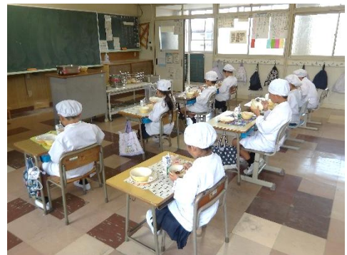
給食も始まりました。ハヤシライス美味しかったです！