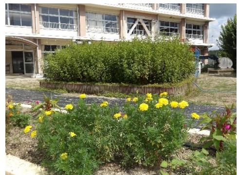
フジバカマの背丈は1m以上になりました。アサギマダラの飛来が楽しみです。