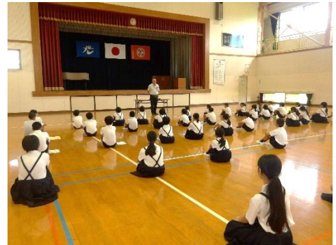
落ち着いた雰囲気の中、全校朝会が行われました。