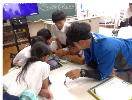
【飛行コースをプログラムします】