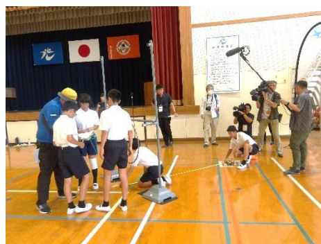
【目標物までの距離を計測します】

子どもたちが大人になる10年後、20年後には、ドローンが、今よりもっと身近なものになっているかもしれません。今回のような学びを継続的に進めていくことで、子どもたちの「未来を創る力」が、さらに育まれていくことを願っています。