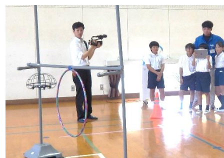
【ドローンを飛ばしています】